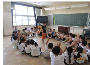
はじめましての会